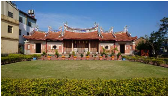
(大肚磺溪書院，謝備殷攝)